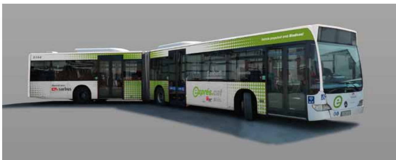
Vehicle de 18 m