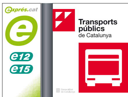
Pal de parada compartida