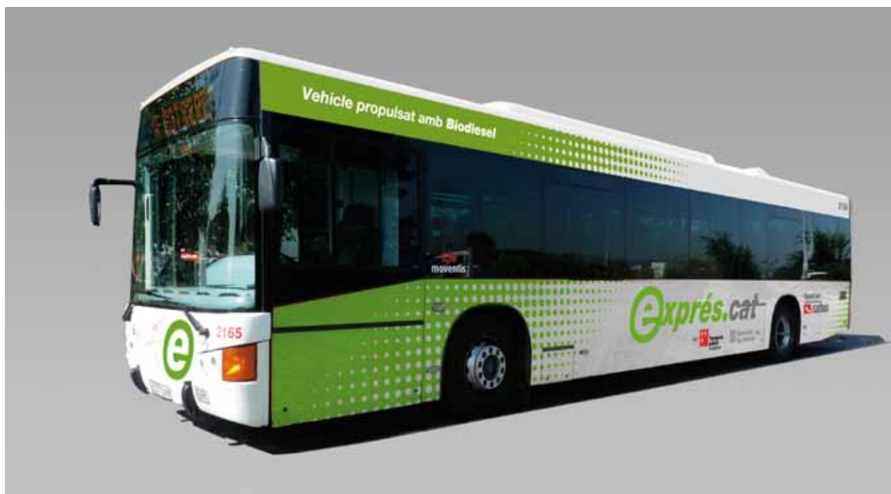
Vehicle de 14 m